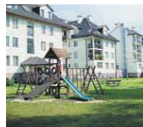
ul. Dobrego Pasterza -Naczelną (1996)