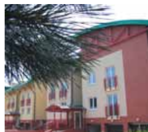
ul. Korzeniowskiego (2004)