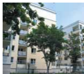
ul. Rydla (2002)